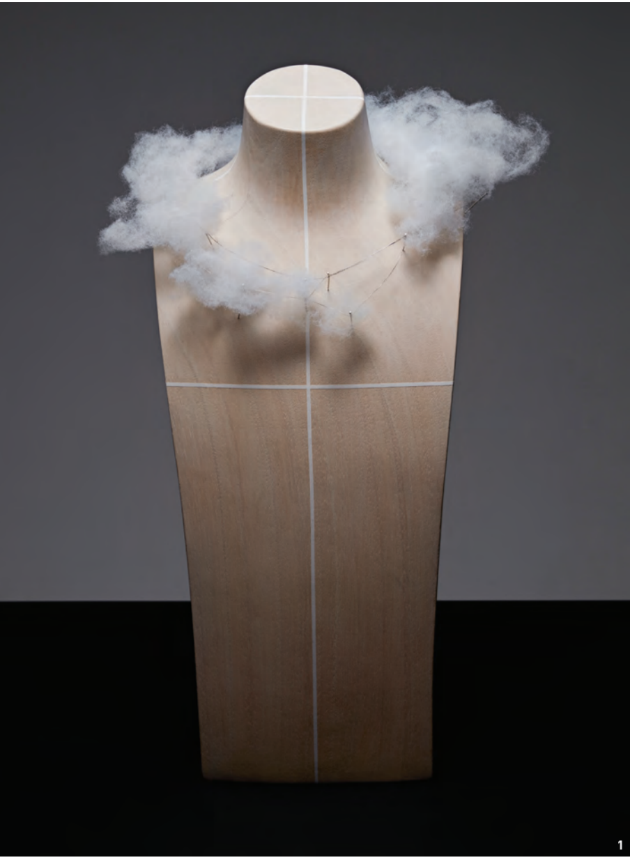
1 2020년 7월 까르뜨 블랑슈, 콩팅플라시옹(Contemplation) 컬렉션에서 선보인 '누아주 앙 아프상튀(Nuage en Apesanteur)' 네크리스 작업. 2 누아주 앙 아프상튀 네크리스. 3, 4 이스뚜와 드 스틸 2025 하이 주얼리 컬렉션, 길들여지지 않은 자연. 5, 6 2026 이스뚜와 드 스틸 하이 주얼리 컬렉션 프레데릭 부쉐론의 '어드레스(The Address)' 네크리스. 7, 8 까르뜨 블랑슈 2024 하이 주얼리 컬렉션, 오어 블루 카스카드(Cascade) 네크리스. 부쉐론 역사상 가장 긴 길이 (148cm)를 기록했다. 9, 10 까르뜨 블랑슈 2025 하이 주얼리 컬렉션, 임퍼머넌스 컴포지션(Composition) N°4. 11 왼쪽부터 부쉐론 CEO 엘렌 폴라-뒤켄과 크리에이티브 디렉터 클레어 슈완.