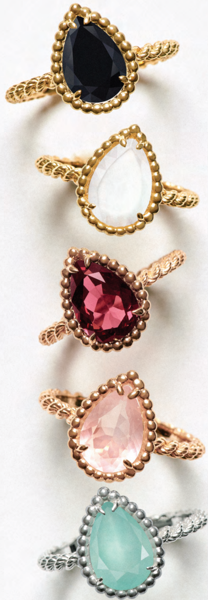
(위부터) 블랙 오톨렉스를 세팅한 썬벡 보웬 오톨렉스 스톨 링, 페어 컷 머더오브펠을 더한 썬벡 보웬 머더오브펠 스톨 링, 로돌라이트 가닛의 썬벡 보웬 로돌라이트 스톨 링, 페어 컷 핑크 퀴츠가 돋보이는 썬벡 보웬 핑크 퀴츠 스톨 링, 화이트 골드 비즈로 둘러싸인 썬벡 보웬 아쿠아프레이즈 스톨 링 모두 부쉐론.