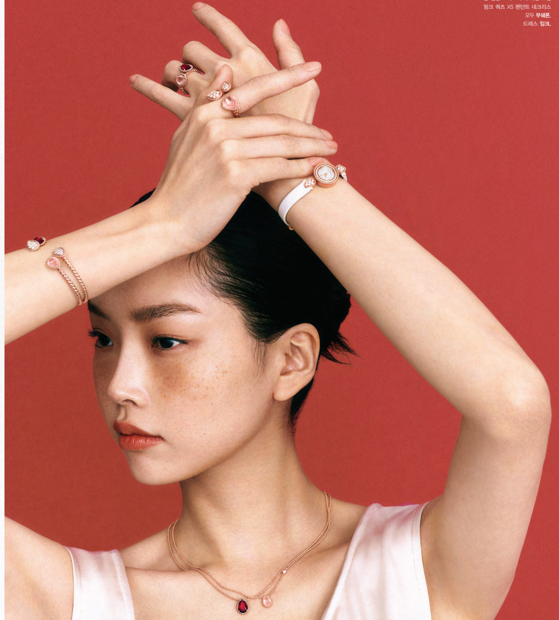
(위부터) 1.9캐럿 로돌라이트 가닛을 더한 썬벡 보웬 로돌라이트 스톨 링, 1.35캐럿의 페어 컷 핑크 퀴츠를 세팅한 썬벡 보웬 핑크 퀴츠 스톨 링, 핑크 퀴츠 드롭과 다이아몬드를 파베 세팅한 2개의 드롭 모티브가 조화를 이루는 썬벡 보웬 핑크 퀴츠 트리플 모티브 링, 4개의 다이아몬드 인덱스로 장식한 화이트 머더오브펠 다이얼의 썬벡 보웬 핑크 골드 다이아몬드 워치, 강렬한 레드 컬러의 썬벡 보웬 로돌라이트 스톨 모티브 밴드, 페어 컷 핑크 퀴츠와 8개의 라운드 컷 다이아몬드로 장식한 썬벡 보웬 핑크 퀴츠 스톨 모티브 밴드, 로돌라이트 가닛의 드롭 모티브가 돋보이는 썬벡 보웬 로돌라이트 스톨 펜던트 네크리스, 썬벡 보웬 핑크 퀴츠 XS 펜던트 네크리스 모두 부쉐론. 드레스 링크.