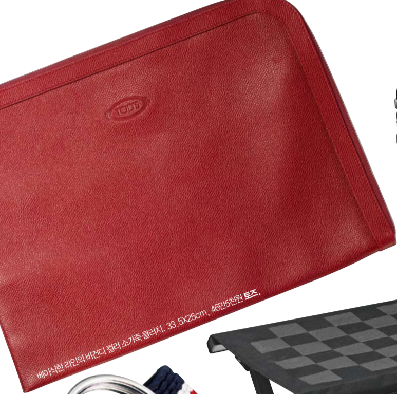
베이스한 라인의 버건디 컬러 소가죽 클러처. 33.5X25cm, 46만5천원 토즈.