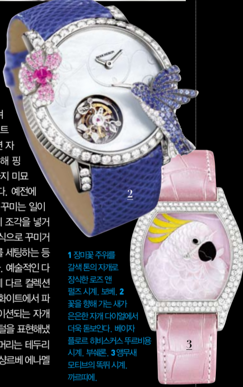
1 장미꽃 주위를 갈색톤의 자개로 장식한 로즈엔 펠츠 시계, 보베. 2 꽃을 행하는 새가 은은한 자개 다이얼에서 더욱 돋보인다. 베이저 톨로르 허비스카스 투르비용 시계, 부쉐르. 3 영무늬 모티프의 토크 시계, 까르피에.

여성 시계에서 가장 보편적으로 사용되는 소재가 자개이다. 자개 특유의 색과 무늬를 이용하는데 그 은은함이 아주 여성스럽기 때문이다. 화이트에서 블랙, 그레이 등 천연 자개부터 약간의 염색을 더해 핑크와 블루와 같은 여러 가지 미묘한 색으로 표현하기도 한다. 예전에는 다이얼 전체를 자개로 꾸미는 일이 많았지만 요즘에는 자개에 조각을 넣거나 자개 잘라 모자이크 형식으로 꾸미거나 자개 위에 다이아몬드를 세팅하는 등 다채로운 방법을 사용한다. 예술적인 다이얼에 치중하는 까르피에 다른 컬렉션에서 소개한 토크 시계는 화이트에서 파스텔 핑크 컬러로 그레데이션되는 자개 위에 조각을 해서 새의 깃털을 표현해냈다. 새의 눈과 부리, 도가마리는 테두리를 만들고 그 안을 채우는 상르레 에나멜 기법을 사용했다.