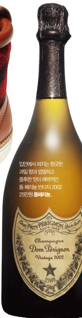
입안에서 퍼지는 향긋한 과일 향과 씹살하고 중후한 맛이 매력적인 돔 페리뇽 빈티지 2002. 25만원 돔페리뇽.