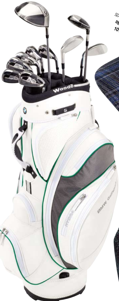
스포티한 감각이 느껴지는 골프 키트 백. 40X35X93cm, 58만3천원 BMW.

액티브한 주말을 즐기는 남성을 위한 유니크한 감성의 캐주얼 아이템. 아웃도어 라이프를 연상케 하는 동물 모티브 니트, 깃털 브로치, 트레킹 부츠부터 야외 활동 시 필요한 접이식 의자, 카메라 케이스까지.