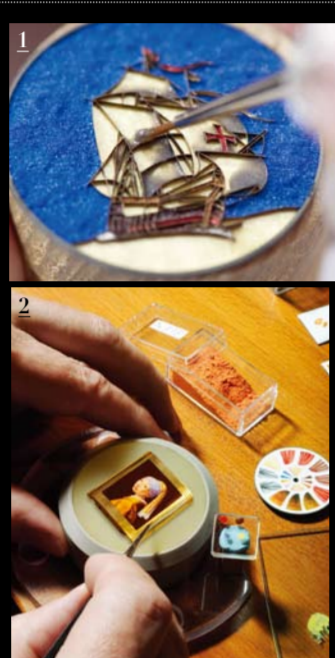
1 금속 실로 형태를 만든 후 에나멜을 채우는 신마리코 시계 다이얼, 올리브 나르덴. 2 페르메이르의 진주 귀조리를 한 소녀를 그리는 에나멜 재현했다. 예가르르르. 3 그랑 외 다이얼에 인텍스를 넣는 과정, 올리브 나르덴. 4 그랑 외 방식으로 구운 화이트 다이얼 위에 한자 달력을 그린 빌레 트레비신 차이나즈 캘린더 시계, 블랑팡. 5 블랙 에나멜 그린 뒤 그 위에 리모주 화이트 칼라를 덮고, 이를 송곳으로 구멍내어 바탕의 블랙이 드러나도록 하는 그리자유(grisaille) 에나멜 방식으로 오리안을 묘사한 로몽드 드 카르피에 시계, 카르피에.

결국 선택에 있어 디자인이 가장 중요하다. 시간만 알려주는 패패 추월 캘린더 기능을 하든, 스테인리스 스틸이든 골드나 플래티넘 이든, 가격이 저렴한 초고가이든 결국 이를 구입하는 고객이 가장 좋아하고 자신에게 잘 어울리는지 여부에 대한 고민이 최종 선택을 좌지우지할 것이라 말이다. '무조건 예뻐야 해'라는 명제가 진실이 되는 순간이다. 그런 의미에서 시계의 얼굴이 되는 다이얼은 중요하다. 기계식 시계를 보면 증거가 제품은 무브먼트를 직접 제조하는 기술이 없거나 설비를 갖추기 힘들기 때문에 ETA나 셀리타 등 무브먼트 전문 제조사에서 만든, 널리 쓰이는 무브먼트를 공급받아 쓰는 경우가 많다. 각 브랜드에서 거기에 약간의 수정을 하기도 하고 개성에 맞는 다이얼과 케이스로 감싸면 같은 완전히 다른 시계가 되는 것이다. 같은 무브먼트라도 소재나 마무리에 따라 가격이 천차만별인데, 여기에 다이얼이 큰 부분을 차지한다. 하이엔드급 시계 브랜드에서는 인하우스 무브먼트에 쓰는 열정만큼 다이얼에도 아주 많은 시간과 노력을 들인다. 에나멜, 인그레이빙, 기요세, 켈 세팅 등 좀 더 세밀한 공예 기술이 사용된다. 시간을 표시하는 인텍스도 도장처럼 찍어내는 것이 아니라 로마자든 바든 각각 제작해서 하나하나 부착하는 방식이다. 최근 시계 다이얼을 살펴보면 한 가지보다 여러 가지 공예적 요소를 복합적으로 사용하는 예가 늘고 있다. 누구나 쉽게 따라 할 수 없는, 복제 불가능한 것으로 시계 자체의 가치를 예술품의 경지로 높여주는 방법으로 자리 잡고 있다.