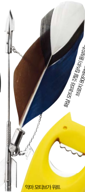
악마 모티브가 화이트 있는 디아볼릭스 보틀 오픈너. 2만8천원 알레시.