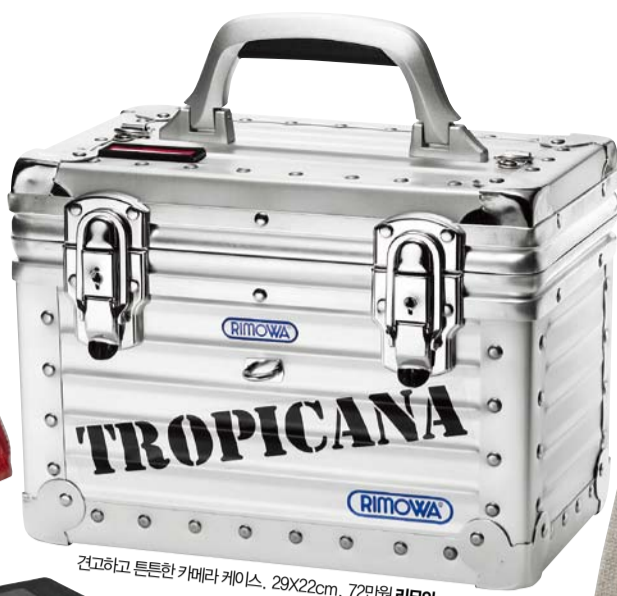
견고하고 튼튼한 카메라 케이스. 29X22cm, 72만원 리모와.