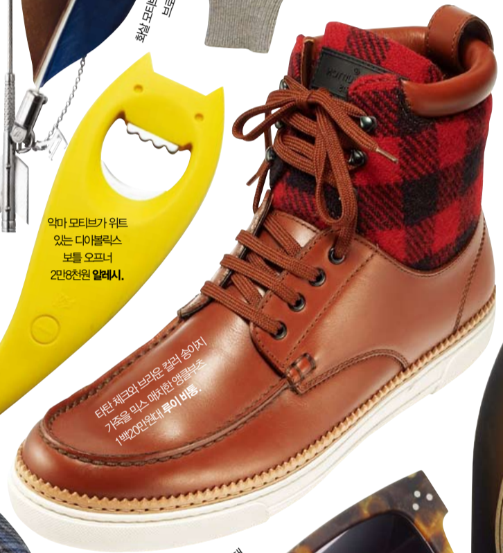
타탄 체크와 브라운 컬러 송아지 가죽을 믹스 매치한 앵글복트. 1백20만원대 루이비통.