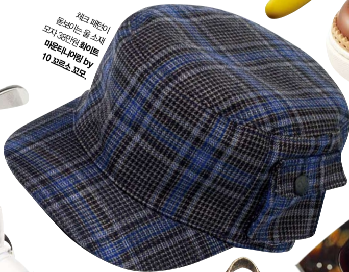
체크 패턴이 돋보이는 울 소재 모자. 38만원 화이트 마운틴-어림 by 10 포르스 꼬모.