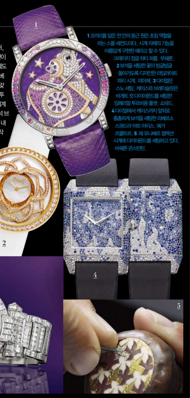
1 코카리트를 얹은 천인의 동근 원은 초침 역할을 하는 스노 세팅이다. 시계 자체의 기능을 아름답게 구현한 예라고 할 수 있다. 크레이지 장군 허리 패들, 부쉬론. 2 보석을 세팅한 꽃이 방금방금 돌아다니도록 디자인한 라모리아트 파티 시계, 파티제. 3 다이얼은 스노 세팅, 케이스와 브레이슬릿은 바게트 컷 다이아몬드를 세팅한 임페리얼 투르비용 톱셋, 쇼파드. 4 다이얼에서 케이스까지 일체로 총총하게 보석을 세팅한 리베르스 스카드라이트 아이스, 예가르르르. 5 레우, 베르 캄페션 시계에 다이아몬드를 세팅하고 있다. 비쉐르 캄스틴.

여성 시계의 최고봉은 보석이다. 다이아몬드, 사파이어, 루비 등과 같은 가치 있는 보석을 총총하게 세팅하는 것이 여성 시계의 미덕처럼 여겨졌다. 최근에는 남성 시계에도 이런 보석을 장식하긴 하지만 말이다. 쇼파드의 폴 파베 다이아몬드 시계처럼 보석이 많이 들어기면 디자인에 맞는 적절한 크기와 컬러의 보석을 찾는 데 오랜 시간을 투자한다. 올해 우블로가 소개한 5백만달러짜리 빅뱅 시계는 보석을 찾는 데만 8개월이 소요됐다는 후문이다. 보석 브랜드마다 특유의 세팅법이 있듯이 시계 브랜드도 각자 내 세우는 세팅법이 있다. 예컨대 예가르르르의 크고 작은 보석을 총총하게 세팅하는 스노 세팅을 자랑한다. 올해 68회를 맞은 베니스 국제영화제를 기념해 소개한 리베르스 스카드라이트 아이스는 1천7백55개의 사파이어, 1천3백 개의 다이아몬드를 다이얼 앞뒤에 세팅했다. 쇼파드의 시계도 스노 세팅이다. 각기 다른 자리의 다이아몬드로 총총하게 세팅했다. 색이 미묘하게 다른 자석으로 파워 리저브 인디케이터를 표시한 것이 특징이다. 주얼리와 달리 시계에 보석을 사용하면 케이스 두께가 두꺼워지는데 여기에 신경을 쓰는 편이다.