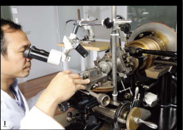
1 기요세 작업에도 현미경이 동원된다. 비쉐르 캄스틴. 2 5~6가지 기요세 무늬를 사용한 클리프 크로노메트리, 브레게. 3 각자 무늬로 꾸미는 로알 오코 테라스트리 다이얼, 오데마 피게.