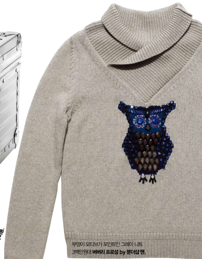
부엉이 모티브가 포인트인 그레이 니트. 3백만원대 버버리 프로섬 by 본더샵 맨.