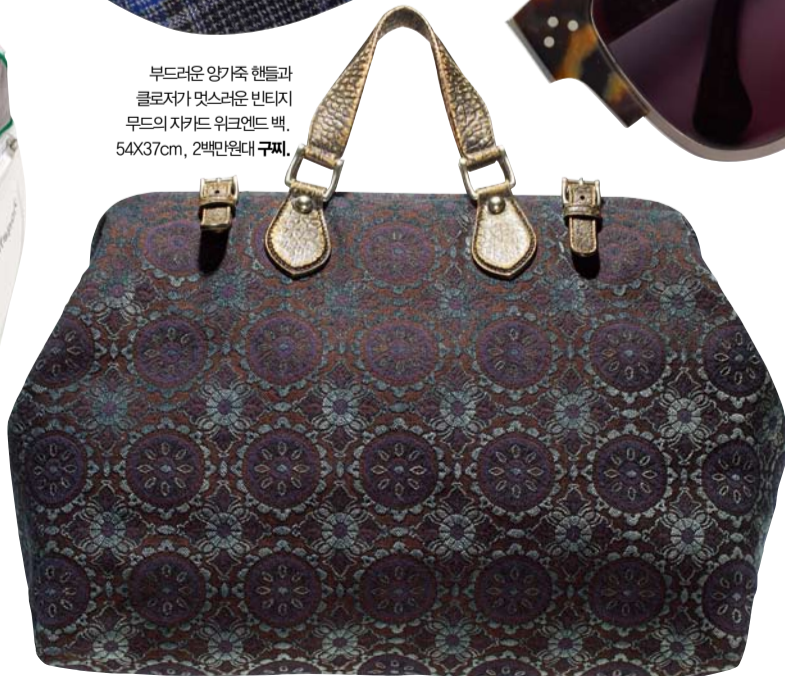
부드러운 양가죽 핸들과 클로저가 멋스러운 빈티지 무드의 자카드 워크엔드 백. 54X37cm, 2백만원대 구찌.