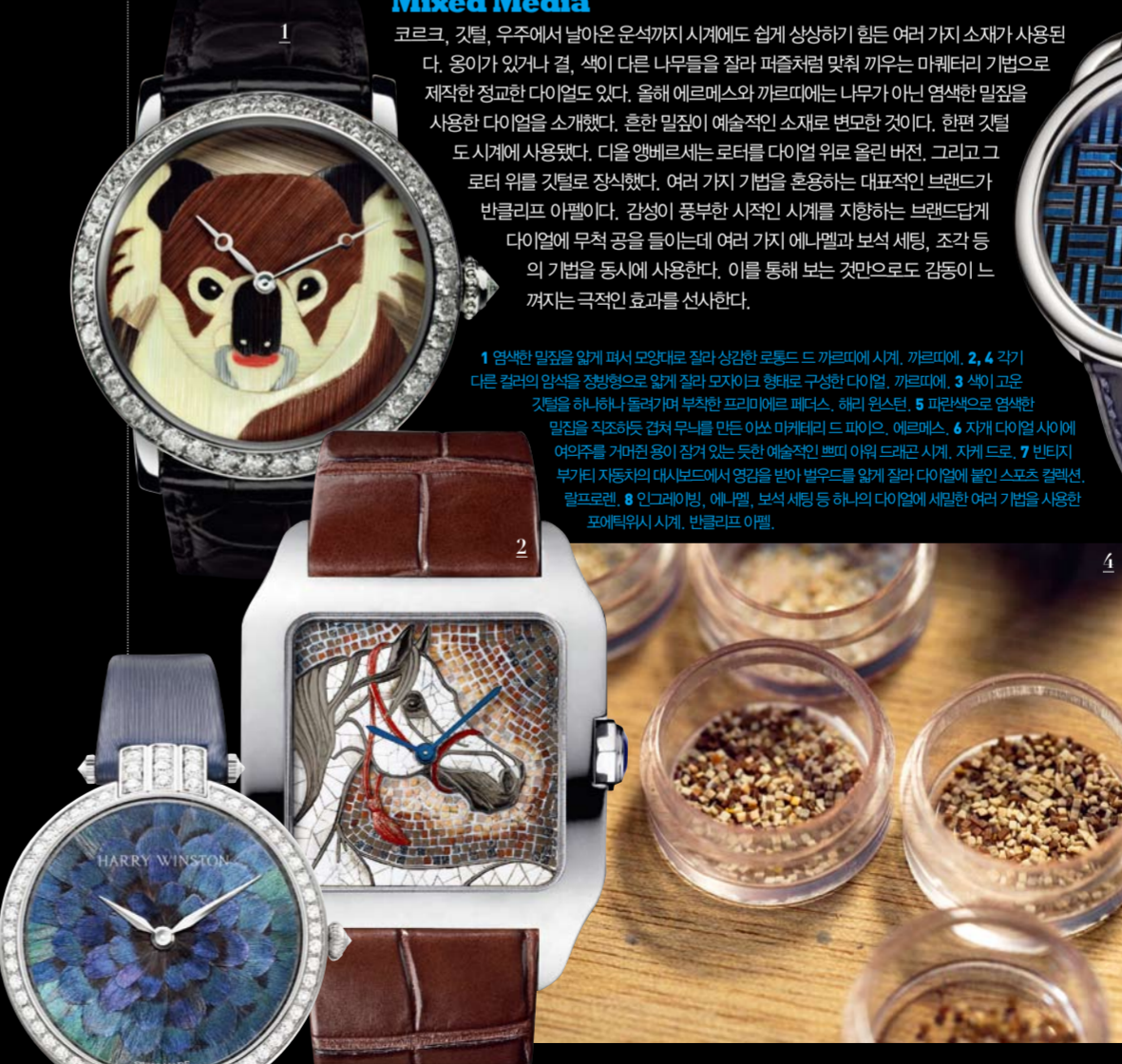
1 염색한 밀짚을 얹어 퍼즐 형태로 잘라 상강한 로몽드 드 카르피에 시계, 까르피에. 2 각기 다른 컬러의 양상을 장형으로 얹어 잘라 모자이크 형태로 구성된 다이얼, 까르피에. 3 색이 고운 깃털을 하나하나 둘러싸며 부착한 모리엘 페르스, 해리 윈스턴. 5 미완성으로 염색한 밀짚을 직조하듯 감쳐 무늬를 만든 아반 미헨테리 파이오, 에르메스. 6 자개 다이얼 사이에 여우늪을 가리키는 용이 잠겨 있는 듯한 예술적인 브러쉬 드래곤 시계, 자개 드로. 7 빈티지 부가티 자동차의 대시보드에서 영감을 받아 발무드를 얹어 잘라 다이얼에 풀인 스포츠 컬렉션, 람프르렌. 8 인그레이빙, 에나멜, 보석 세팅 등 여러 다이얼에 세팅한 여러 기법을 사용한 포에터워시 시계, 반클리프 아펠.

코르크, 깃털, 우주에서 날아온 운석까지 시계에도 쉽게 상상하기 힘든 여러 가지 소재가 사용된다. 용이가 있거나 결, 색이 다른 나무들을 잘라 퍼즐처럼 맞춰 끼우는 미헨테리 기법으로 제작한 정교한 다이얼도 있다. 올해 에르메스와 까르피에는 나무가 아닌 염색한 밀짚을 사용한 다이얼을 소개했다. 흔한 밀짚이 예술적인 소재로 변모한 것이다. 한편 깃털도 시계에 사용됐다. 다음 앙베르세는 로테를 다이얼 위로 올린 버전, 그리고 그로터 위를 깃털로 장식했다. 여러 가지 기법을 혼용하는 대표적인 브랜드가 반클리프 아펠이다. 감성이 풍부한 시적인 시계를 지향하는 브랜드답게 다이얼에 무척 공을 들이는데 여러 가지 에나멜과 보석 세팅, 조각 등의 기법을 동시에 사용한다. 이를 통해 보는 것만으로도 감동이 느껴지는 극적인 효과를 선사한다.