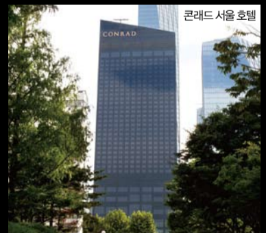
콘래드 서울 호텔

모벨랩 에뉴얼 세일 모벨랩에서는 창립 기념달인 매년 10월 에뉴얼 세일을 진행한다. 책상, 의자, 다인 테이블, 사이드 보드 등 이번 행사를 위해 준비한 가구를 최대 40% 할인한 가격으로 만날 수 있다. 서울 성북동 소문에서 진행하며, 기간은 10월 5일부터 28일까지다. 문의 02-3676-1000