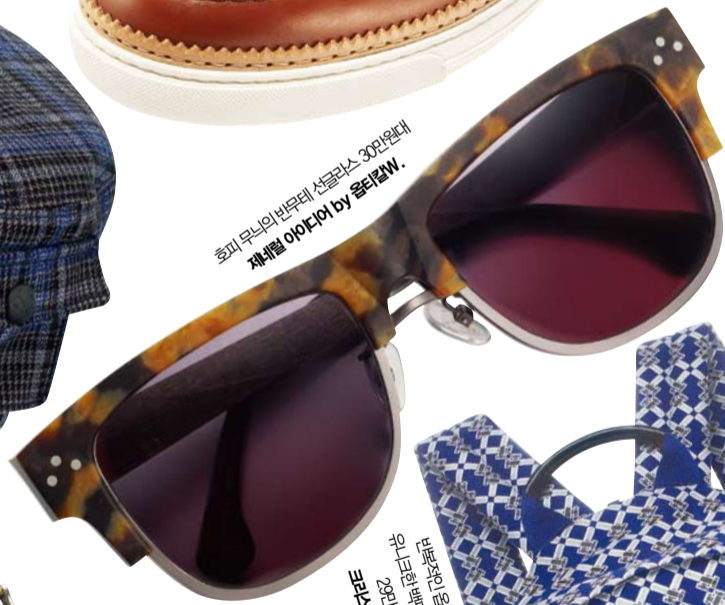
호피 무늬의 빈티지 선글라스. 30만원대 캐주얼 아이디어 by 울타임W.