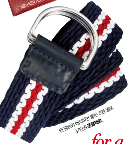
면 팬츠와 매치하면 좋은 코튼 벨트. 37만원 몽클레르.