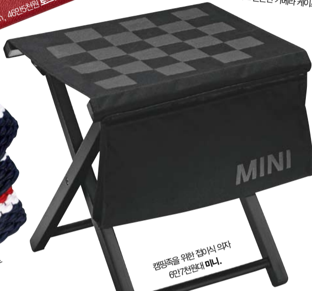
캠핑족을 위한 접이식 의자. 62만7천원대 미니.