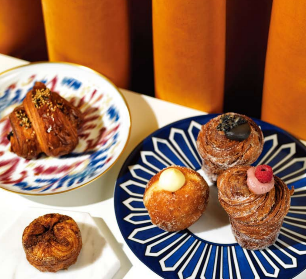
캠리피노아 크루아상을 담은, 아몬드 치즈 기법에서 영감을 받은 화려한 패턴의 정사각 비바도틀루 롤과 파냥시에는 블루 다이아 플레이트 모두 에디터 소장품.

미국 샌프란시스코의 핫 플레이스인 미스터 홀츠 베이커리하우스를 기점으로 그대로 재현했다. 자연 속의 과정을 거쳐 만드는 무표백 밀가루와 유기농 생강, 프랑스산 버터 등 최상의 재료로 고집하는 이곳의 시그처 메뉴는 후후룩 마시고 싶은 달콤한 크림을 넣은 도넛인 브리오쉬 도넛과 머핀처럼 생겼지만 식감은 크루아상에 가까운 크루아도. 이 2개의 디저트에 채우는 필링은 매일 두 가지 맛으로만 선보이며, 특별히 원하는 맛이 있다면 미리 찾아보고 가기를 추천했다. (왼쪽 위부터 시계 방향으로) 훈제 연어와 와사비, 김을 넣은 캄리피노아 롤을 재현한 캄리피노아 크루아상 5천원, 각각 흑임자 크림과 라즈베리 크림을 얹은 크루아 6천원, 바닐라 커스터드 크림을 넣은 브리오쉬 도넛 3천원, 크러민 반죽을 캐러멜라이즈해서 틀에 넣고 구운 아멜리아 롤 4천원, 모두 미스터 홀츠 베이커리하우스, 문의 02-547-2004