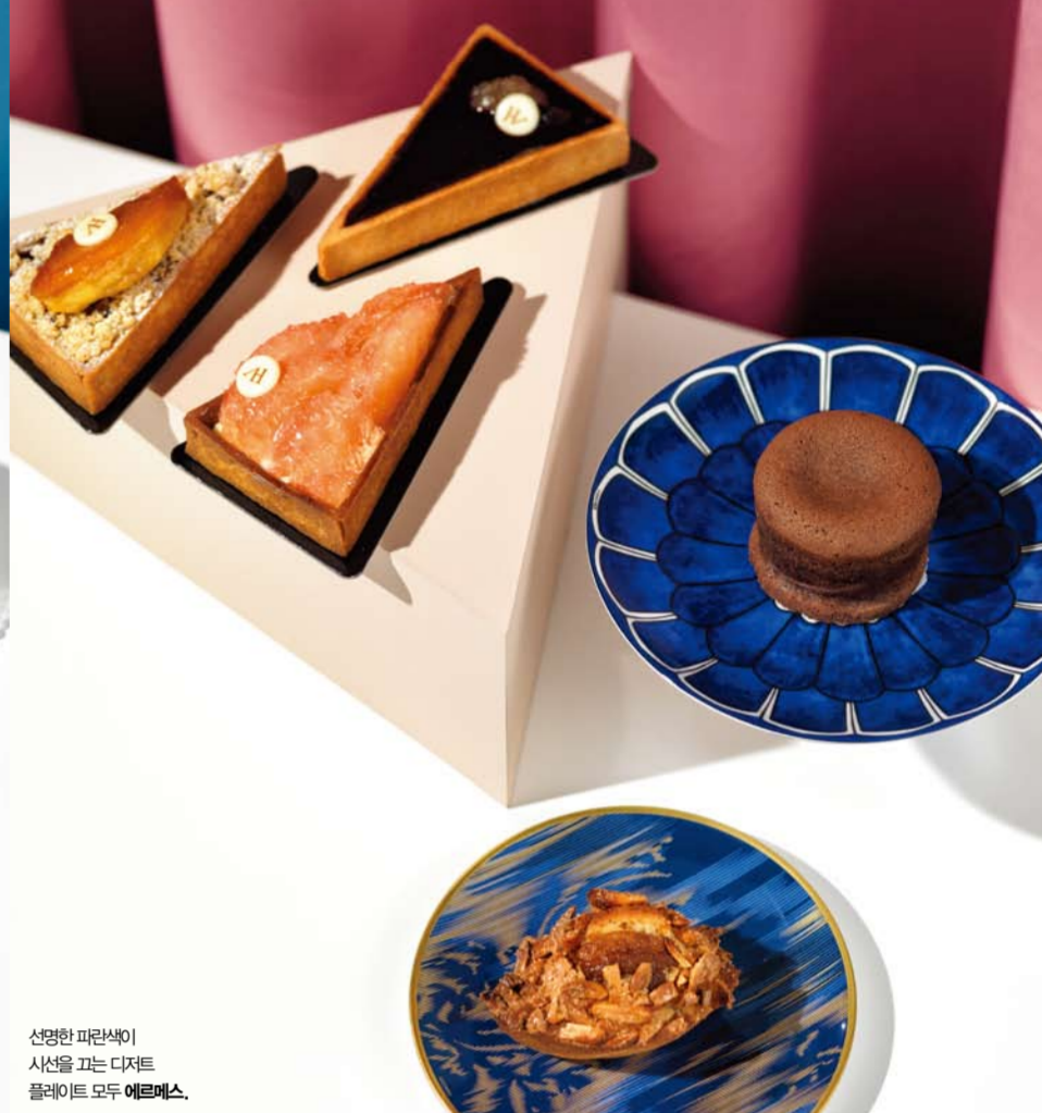
선명한 파란색이 시선을 끄는 디저트 플레이트 모두 에디터 소장품.

미술형 3스타 강태의 페이스트와 피터에게, 위고 루제의 디저트가 롯데백화점 본점에 올랐다. 프랑스 3대 디저트 작가인 위고 앤 빅토르가 팝업 스토어가 아닌 공식 매장을 오픈한 것은 서울 매장이 처음. 지중해 라임, 패션 프루트 등 생생한 과일과 소콜라, 발 카사스가 어우러져 반짝이는 유색 보석을 연상시키는 티라미토와 글리 모양으로 만든 과자인 파냥시에가 이곳의 시그처 메뉴다. (왼쪽부터 시계 방향으로) 시트를 넣어 구운 시터 티라미토 6천원, 패션 프루트와 페이스트로 만든 발 카사 티라미토 8천원, 이곳의 대표 메뉴인 지중해 크림과 생크림 조각으로 장식한 지중해 티라미토 7천원, 빈으로 자른 달콤한 초콜릿이 녹아 흐르는 몽상 오소콜라 4천원, 너트 파냥시에 2천원, 모두 위고 앤 빅토르, 문의 02-726-4068