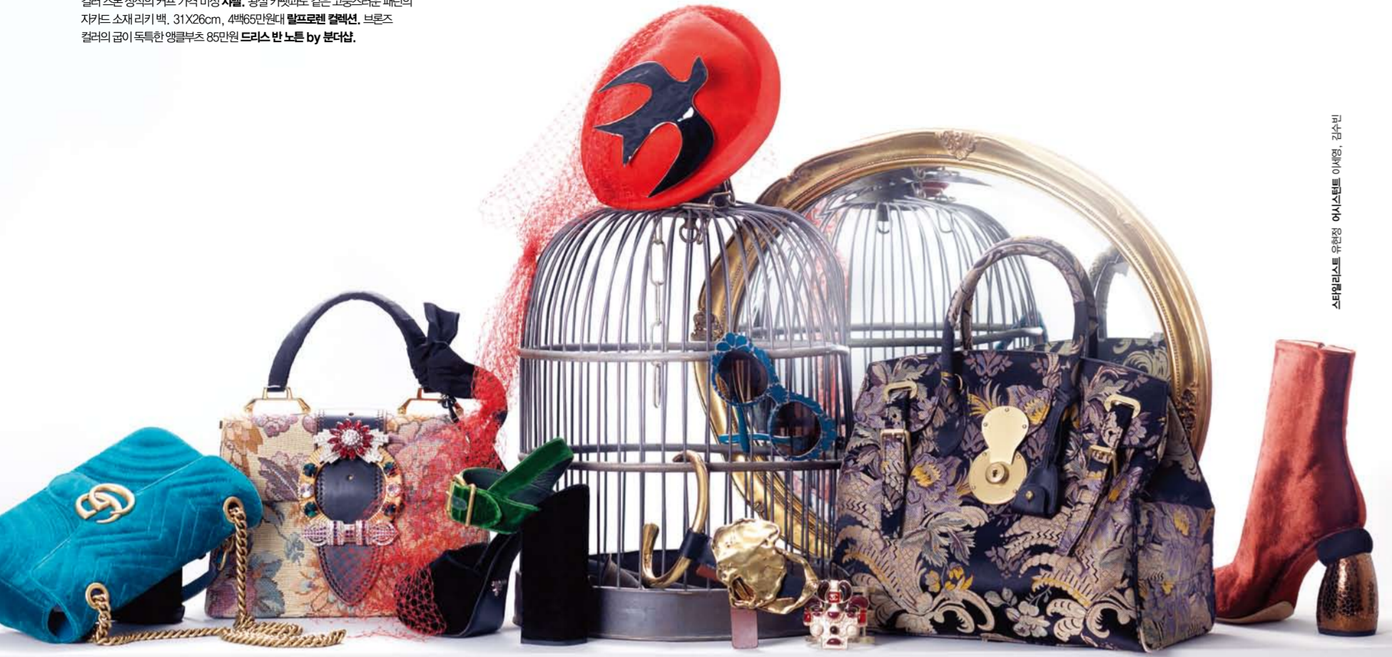
스타일링: 유영정, 헤어: 스타일토 이서영, make: 김수빈

(왼쪽부터) GG 버클 장식이 돋보이는 블루 벨벳 마린트 백, 26X17cm, 2백15만원 구찌 , 향황색의 젤스톤으로 포인트를 준 토트백, 27X20, 5cm, 3백20만원대 미우미우 , 딥 그린 컬러 스트랩이 돋보이는 플랫폼 샌들 1백만원대 프라다 , 레드 베일을 부착한 플랫폼 소재 햇 62만5천원 구찌 , 새 모티브의 브로치 75만원 나비피피 by 분더샵 , 일체적인 프레임의 신글라스 40만원대 돌체간자비나 by 루스티카 , 브라스 소재의 중커 1백30만원대 틀 포드 , 컬러 스톤 장식이 컷팅 기적 마징 샤넬 , 왕실 컷팅과도 같은 고풍스러운 패턴의 자카드 소재 리키 백, 31X26cm, 4백95만원대 발로르엔 컬렉션 , 브론즈 컬러의 굵이 독특한 앵글루부츠 85만원 드리스 난 드로 by 분더샵 .