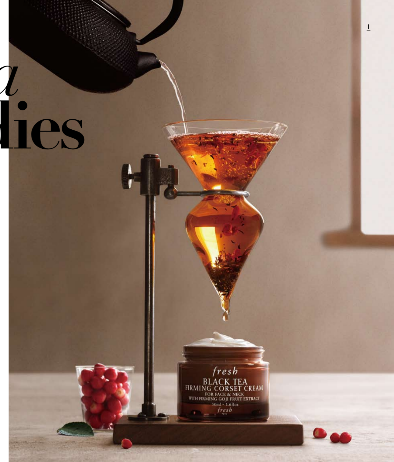
1 즉각적인 탄력 개선 효과가 뛰어난 블랙티 퍼밍 코르셋 크림, 마치 차를 우려낸, 곰부처의 유용 성분을 추출하고 안티에이징 효과가 뛰어난 고지 열매 추출물을 더해 최상의 안티에이징 효과를 낸다. 2 집중 케어 효과가 블랙티 에이지-딜레이 퍼밍 세럼, 3 블랙티 3-스텝의 핵심 요소인 블랙티 퍼밍 코르셋 크림, 4 프레쉬의 스페셜 케어 라인 블랙티 퍼밍 오버나이트 마스크.

세럼과 크림, 마스크로 이어지는 블랙티 퍼밍 3-스텝이 신제품 크림은 퍼밍(firming), 즉각적으로 피부 탄력을 높이는 데 놀라운 효과를 지니고 있는데, 프레쉬 리서치 랩에서는 '리틀 레드 다이아몬드'라고도 불리는 고지 열매 추출물의 특별한 퍼밍 효과에 주목해 이를 극대화하는 데 노력을 기울였다. 기존의 곰부처 성분을 기반으로 고지 열매 추출물의 효과를 더해 얼굴과 목의 피부를 보다 탄탄하게 강화하고 탄력을 개선해 매끄럽게 정돈된 피부를 선사하는 것이다. 이 크림의 효과를 더욱 극대화하고 싶다면 블랙티 컬렉션의 핵심 제품인 마스크와 세럼, 크림 등 세 가지 제품으로 함께 케어해 즉각적으로 피부 탄력을 개선할 수 있다. 일명 피부 퍼밍 작용을 일으키는 3중 세틴인 세틴데, '블랙티 에이지-딜레이 퍼밍 세럼', '블랙티 퍼밍 오버나이트 마스크'와 크림을 더하면 프레쉬의 '블랙티 퍼밍 3스텝이 완성되는 것. 이 3-스텝의 핵심은 안티에이징에서 가장 중요한 부위이자 관리하기 어려운 목 라인까지 철저하게 케어할 수 있다는 것이다. 먼저 세럼을 얼굴 전체에 가볍게 발라준 후, 블랙티 퍼밍 코르셋 크림을 목에 원두콩 크기로 발라 쇠골부터 턱까지