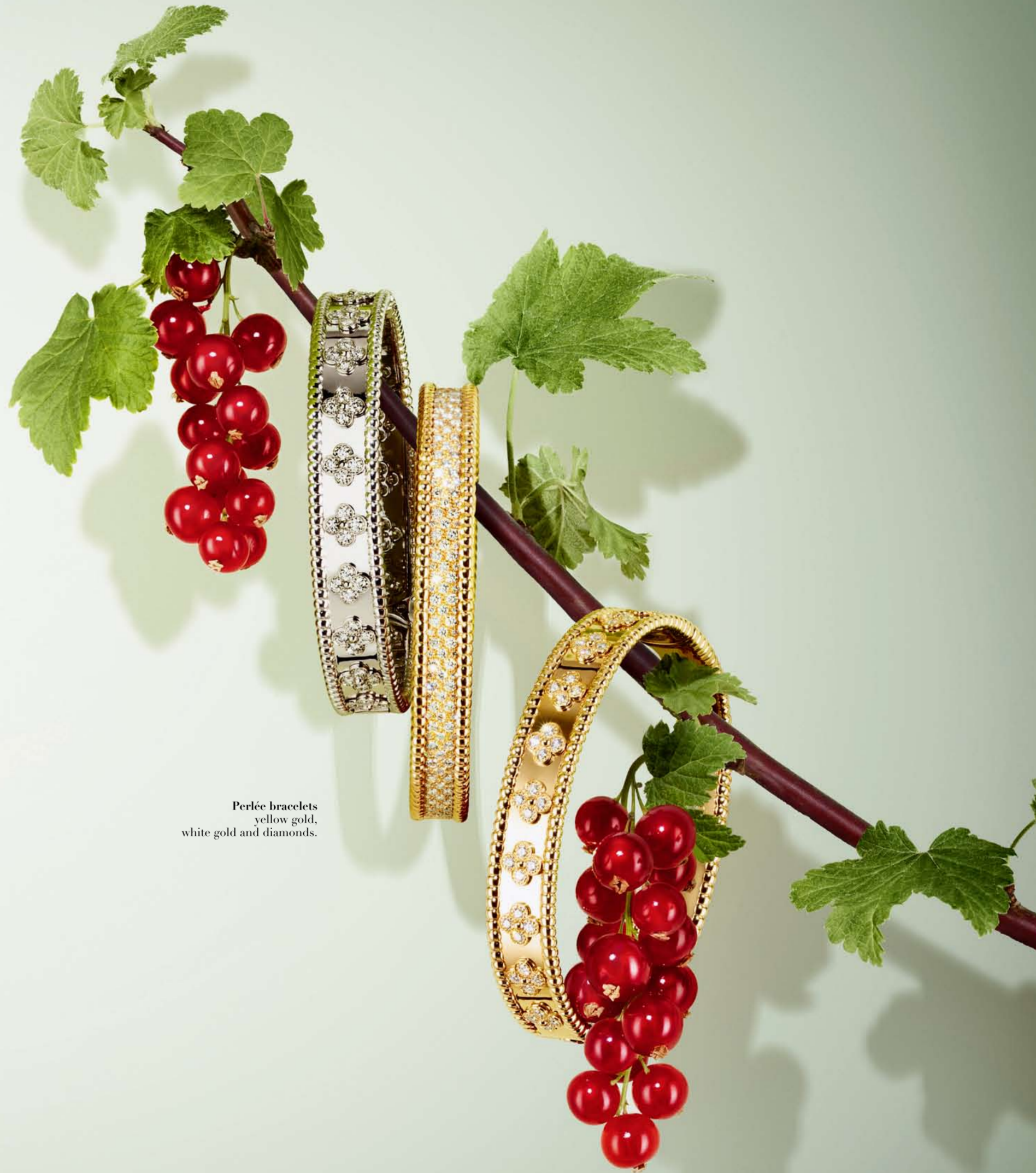
Perlee bracelets yellow gold, white gold and diamonds.