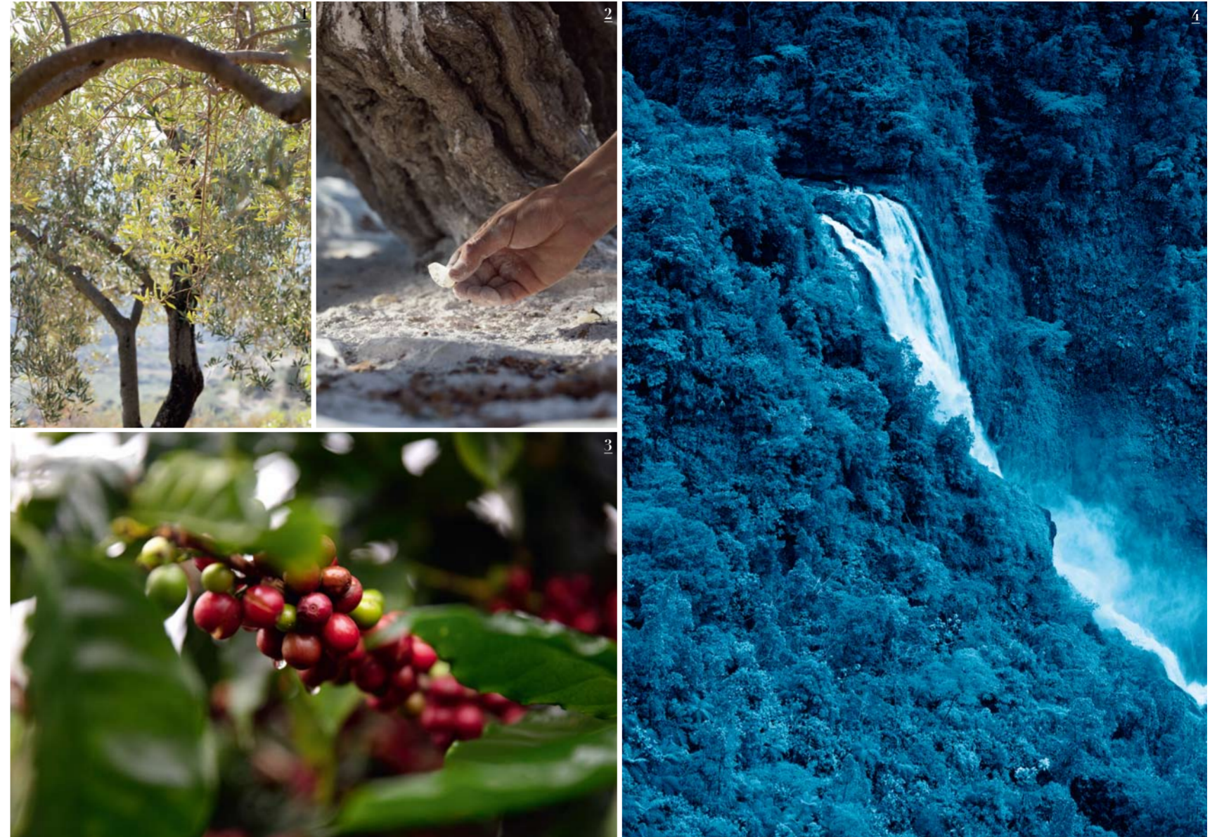
1 이탈리아 사르데냐의 따스한 햇살을 머금은 올리브나무. 2 그리스의 관목에서 채취한 렌티스크 검. 수지가 올라가면 눈을 방울 형태의 결정으로 변한다. 3 코스타리카에서는 '골드 맨'이라 불릴 정도로 귀한 식재료이자, 항산화 성분을 풍부하게 함유한 장수 식품이다. 특히 열매가 익기 전 그린빛을 띠 때 항산화 성분이 더욱 많이 생성되는데, 샤넬 연구소는 이때를 포착해 하나하나 손으로 직접 수확하고 콜드 프레스 공법을 통해 피부 노화에 강력하게 대응하는 분자인 카페스톨과 카페올을 획득한 것. 이는 커피 열매 중 항산화 효과가 5배나 더 많이 함유된 농축물로, 피부 노화를 예방하고 탄력을 끌어올린다. 이와 함께 이탈리아의 식생활에서 필수적인 사르데냐 지역의 올리브도 없어서는 안 될 메인 원료다. 샤넬만의 독보적인 올레오-에코 추출법을 통해 필수지방산, 오메가 3·6·9이 풍부한 올리브 열매와 각종 항산화 성분을 함유한 올리브 잎의 효능을 모두 담아 외부 유해 환경과 스트레스로부터 피부를 보호하고 피부 노화를 예방한다. 또 다른 핵심 성분인 그리스 렌티스크 검은 올리브농산올을 풍부하게 함유해 탁월한 재생 효과를 발휘한다. 고온에 민감한 올리브농산올의 특성을 반영해 초임계 이산화탄소 냉각 추출법을 선택, 성분의 효과를 최대한으로 끌어올린 것이 특징이다. 이처럼 이 세 가지 활성 성분의 복합 작용을 통해 블루 존의 장수 비결인 네 가지 조건을 조절하는 작용이 발현되면서 결과적으로 피부 수명을 증진시키고 피부의 젊음과 본연의 아름다움을 활성화할 수 있는 것이다.

다른 지역에 비해 월등하게 1백 세 이상 장수 인구가 많은 특별한 지역, 블루 존(Blue Zone). 장수 지역으로 유명한 블루 존인 코스타리카, 그리스, 이탈리아 주민들의 장수 비결에 대해 꾸준히 연구해온 샤넬은 이 신비로운 지역이 지닌 비밀을 피부에 접목해 건강하고 아름답게 웰-에이징할 수 있는 특별한 안티에이징 세럼을 선보인다. '피부 장수'를 꿈꾸며 오랜 시간 젊고 건강한 피부를 유지하고 싶은 모든 여성을 위한 현명하고 능동적인 선택, '샤넬 블루 세럼'.