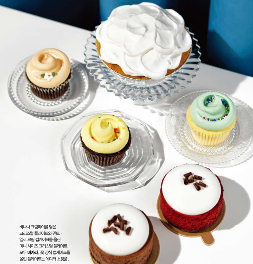
바나나 크림파이를 담은 크리스탈 플레이트와 민트·옐로 크림 캠퍼치를 올린 미니 사이즈 크리스탈 플레이트 모두 바카라, 꽃 장식 캠퍼치를 올린 플레이트는 에디터 소장품.

줄을 서지 않으면 사기 힘들다는 그곳, 매그놀리아 베이커리. 미국 드림바 (앤디 시터)의 주인공 미란다와 캐리가 벤처에 앉아서 먹던 그 캠퍼스가 현재 베이커리점 판교점에 이어 무역센터점에도 동지를 불렀다. 방부제를 일절 넣지 않고, 당일 생산, 당일 판매 원칙을 지키는 홈 베이커리 스타일을 추구한다. (위부터 시계 방향으로) 생크림 케이크와 부드러운 바나나 푸딩 크림을 차곡차곡 채워 넣은 바나나 크림파이 8천원, 한국어로 '죽림'을 뜻하는 브랜드 이름처럼, 아름다운 꽃 모양 생크림을 얹은 캠퍼치 각 3천원~4천원, 폭신촉촉한 레드 벨벳 치즈 케이크와 초콜릿 치즈 케이크 각 8천원, 모두 매그놀리아 베이커리, 문의 031-5170-2233