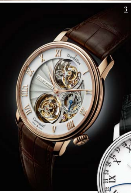
1 블랑팡 롯데백화점 에비뉴엘 월드타워점 부티크 내부 모습. 2 블랑팡의 오랜 히스토리를 그대로 느낄 수 있는 새로운 부티크. 입체적인 스토어 외관이 인상적이다. 3 르 브라쉬 투르비용 카루셀 (Le Brassus Tourbillon Carrousel). 4 빌레레 문이즈 카루셀(Villeret Moonphase Carrousel), 88피스 리미티드 에디션이다.