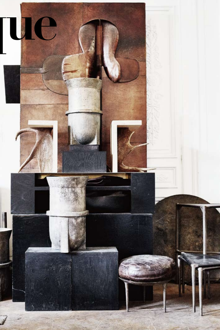
1 파리 7구에 있는 릭 오웬스의 사무실 겸 작업실인 필레 부르봉(Palais Bourbon)에 마련한 집전실. 2 강령전시도 우아한 카리스마를 뽐내는 특유의 스타일로 한국에도 많은 팬을 거느린 릭 오웬스. 3 균형이 없게 배치한 콘크리트 벤치가 눈에 띄는 뉴욕 소호의 릭 오웬스 매장. 그의 표정을 살펴보면 자신에게 걸어진 '반능적인 에너지를 쏟고 엄청난 '발광'을 말하면서 그들의 디자인 가구 컬렉션에 크게 기여한 릭 오웬스의 부인 마셀 레미아가 인터뷰어 디자인을 말했다. 미국 출신인 릭과 프랑스 출신인 마셀은 현재 파리를 주 무대로 활동한다. 4 석화된 나무를 기본으로 하고 북미산 사슴뿔로 장식한 의자. 초기 컬렉션이다. 5 2012년 스위스 저택단(Samedan) 소재의 켈사 플린타 뮤지엄에서 열린 전시 <Magic Mountain>를 통해 선보인 릭 오웬스의 아트 퍼니처 컬렉션.