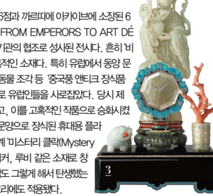
1전시회 도록 표지, 에디션 다르 소모지(Éditions d'Art Somogy) 출판사 발행, 2실 시계-브로치 (Seal Watch-brooch), 까르띠에 파리(1929), Nick Welsh, Cartier Collection © Cartier 3신 모티브의 미스터리 클락(Mystery Clock with Deity), 까르띠에 파리(1931), Marian Gérard, Cartier Collection © Cartier