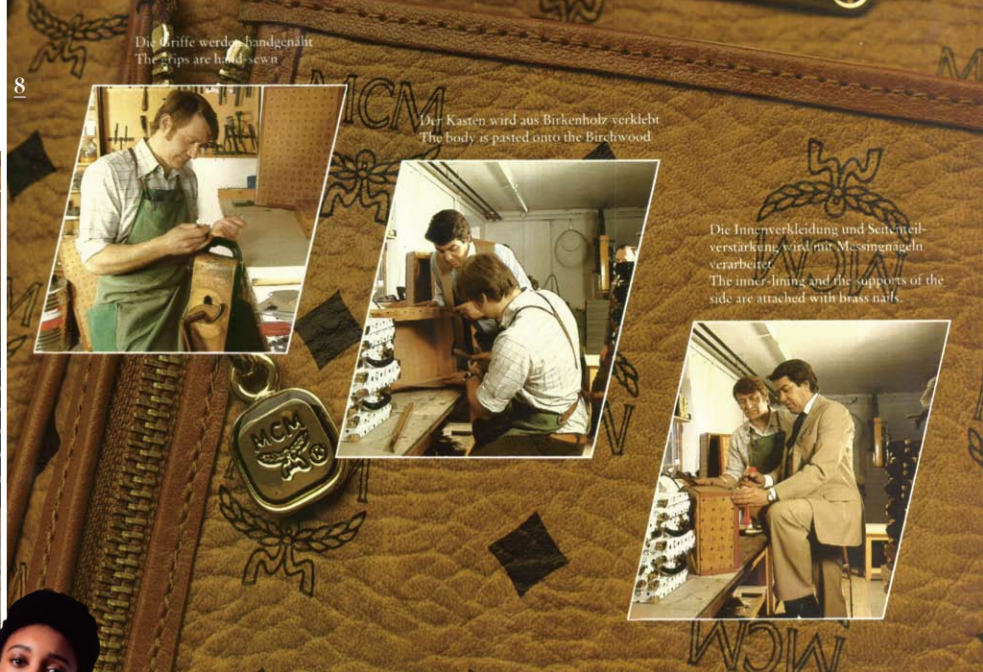
1 MCM 창립 45주년을 기념하여 창립 플래그십 스토어 MCM HAUS에서 선보인 메타버스의 XR 이미지. 2 MCM의 비세토스를 입힌 베를린의 브렌덴부르크 게이트. 3 MCM의 과거 비세토스를 입은 프라운호프 교회의 모습을 담은 뮌헨의 포스트 카드. 4 1970~80년대 글로벌 노매드족의 여행 필수품이었던 MCM. 5 MCM의 시작이자 핵심 키워드는 여행이다. 6 2016년 아티스트 토비아스 레베르거와 협업해 완성한 리미티드 컬렉션. 7 MCM은 대량생산의 아티스트와 협업해 끊임없는 변화를 추구한다. 사진은 MCM X 생바티스트 리미티드 컬렉션. 8 뛰어난 장인 정신은 MCM을 세계적인 럭셔리 하우스로 만들었다. 사진은 1980년대 독일 광부의 모습. 9 MCM X 베르프의 2019년 제품. 10 MCM X 크리스토퍼의 2107년 제품. 11 지속 가능함의 가치를 실현하기 위한 업사이클 프로젝트. 12 소재는 물론 제작 공정도 친환경적인 '타워인 로' 스니커즈. 13 탈향과 발간의 여정을 주제로 2021년 선보인 시그니처 향수 MCM 오드 퍼플. 14 뮌헨과 베를린의 음악적 영감을 담은 2020 S/S 컬렉션. 15 창립 45주년을 기념하여 선보인 빈티지 자켓 모노그램 컬렉션. 16 뮤지션 빌리 아이리시와 2019년 광고 캠페인을 함께했다.

한 뮤지션 페기 구 및 크리에이터 수주쿠 & 브리트부르스트가 모델에 합류하며 1970년대 세계의 중심에 있던 뮌헨을 시작으로 전 세계를 거쳐 새로운 문화의 중심인 베를린과 서울을 잇는다.