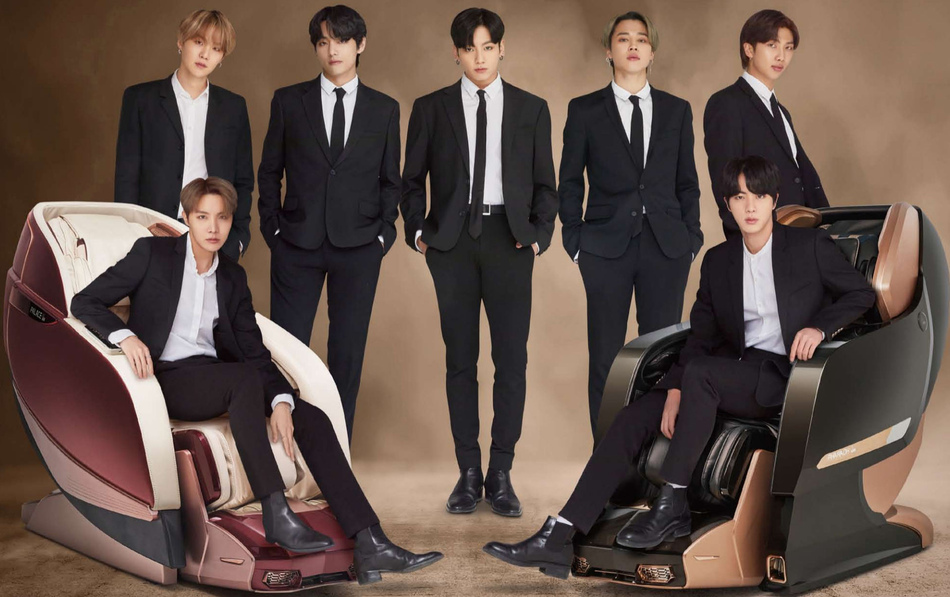
팰리스 II (버건디 브라운)

월 렌탈료 : 24,500원 총 렌탈금액 : 5,575,500원 / 소비자 판매가격 : 540만원