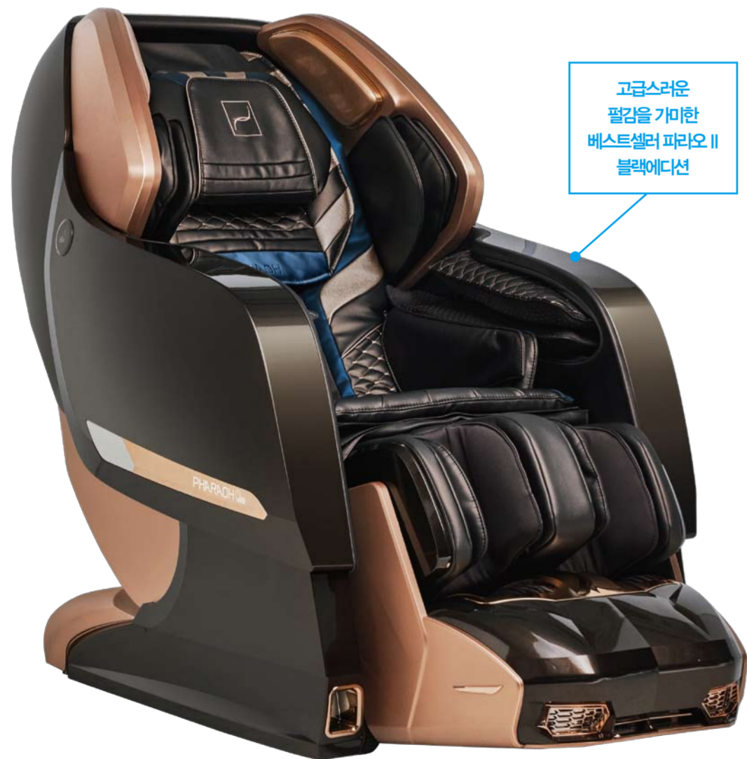
고급스러운 팔감을 가미한 베스트셀러 파리오 II 블랙에디션