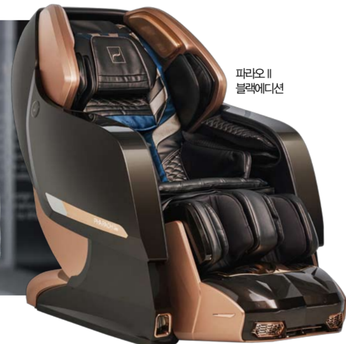
파라오 II 블랙에디션