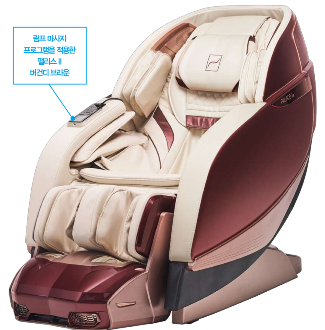
림프 마사지 프로그램을 적용한 파리오 II 바간디 브라운

면역력을 높이기 위해서는 체온을 적절히 유지해 온몸의 순환이 원활하게 이루어지도록 하는 것이 중요하다. 바디프렌드 림프 마사지 프로그램은 특수한 형태의 에어백과 주무름으로 팔과 다리를 집중 마사지해 림프 순환을 돕고 온열 마사지로 몸을 이완시킨다.