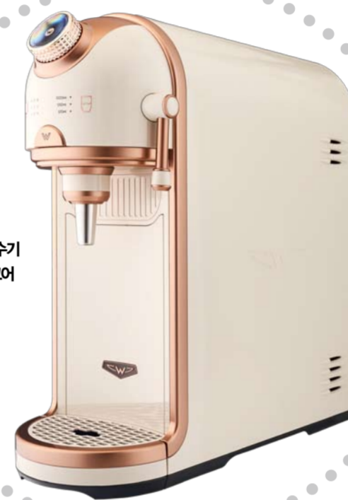
W냉온정수기 브레인 코어

우리 몸의 70%는 물. 한 사람의 수명을 80년으로 가정했을 때 평생 73톤에 가까운 물을 섭취한다는 사실을 상기하면, 좋은 정수기를 까다롭게 선택해야 할 필요성을 절감한다. 2020 국제전자제품박람회(CES) 건강 및 웰빙 부문 혁신상, 6년 연속 2020 코리아 탑 어워즈 혁신 브랜드 대상을 수상하며 최고의 제품으로 인정받은 바디프렌드의 'W냉온정수기 브레인'. 국내에서 유일하게 내부관, 출수 코크 전체에 스테인리스 스틸 소재를 적용한 직수형 정수기로, 자동 살균 및 케어 기능까지 갖춰 세균 번식 가능성을 크게 낮췄다. 혁신적인 필터 시스템 또한 돋보이는 부분. 6단계 정수 시스템을 한 개의 필터에 압축한 자가 교체형 6 in 1 필터는 성능을 강화하는 한편, 여러 개의 필터를 교체해야 하는 번거로움을 줄였다. 덕분에 3개월 주기로 가정에 발송되는 필터를 사용자가 직접 갈아 끼울 수 있어, 비대면 시대에 최적화된 시스템으로 평가받는다. 미국국제위생재단(NSF), 미국수질협회(WQA) 인증 소재를 사용한 필터는 배관의 녹, 찌꺼기는 물론 중금속, 바이러스, 슈퍼박테리아, 살모넬라균, 노로바이러스, 시렐라균, 녹농균 등의 유해 물질을 99.99%까지 제거하며, 한국건설생활환경시험연구원(KCL)의 81가지 정수 성능 테스트와 4대 미네랄(칼슘, 칼륨, 마그네슘, 나트륨) 함유 테스트를 모두 통과했다. 콤팩트한 사이즈, 미래 지향적인 디자인으로 주방 인테리어에 활기를 불어넣는 것 또한 장점이다. 하이퍼카 디테일을 집목한 트렌디한 감성의 'W냉온정수기 브레인'은 이정현 스페셜 에디션 세 가지 버전을 출시한 데 이어, 최근 새롭게 진화한 'W냉온정수기 브레인 코어'까지 선보인다. 크림 화이트 컬러에 로즈 골드 포인트를 더해 세련되고 우아한 감성을 강조한 신제품은 전면 조작부의 변화가 눈에 띈다. 온도를 조절하는 다이얼 디스플레이에 냉수, 정수, 분유, 녹차, 커피 표기로 보다 세밀한 온수 온도를 선택할 수 있도록 했고, 출수량(125ml, 550ml, 1L) 조절 버튼은 기존 레버 대신 터치 버튼 방식을 적용해 쉽고 편리하게 사용 가능하다.