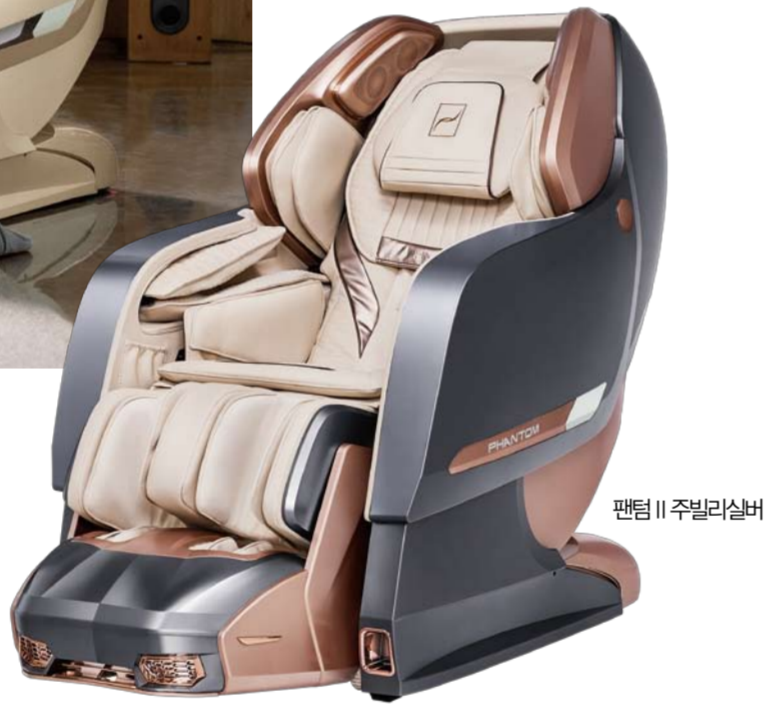
팬텀 II 주빌리실버