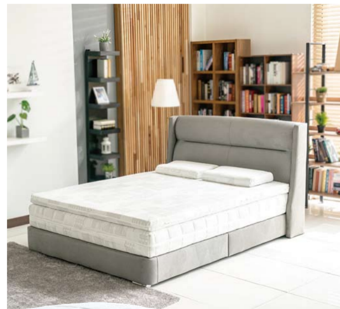
밀라노 프레임과 1+1 토퍼 구독 서비스