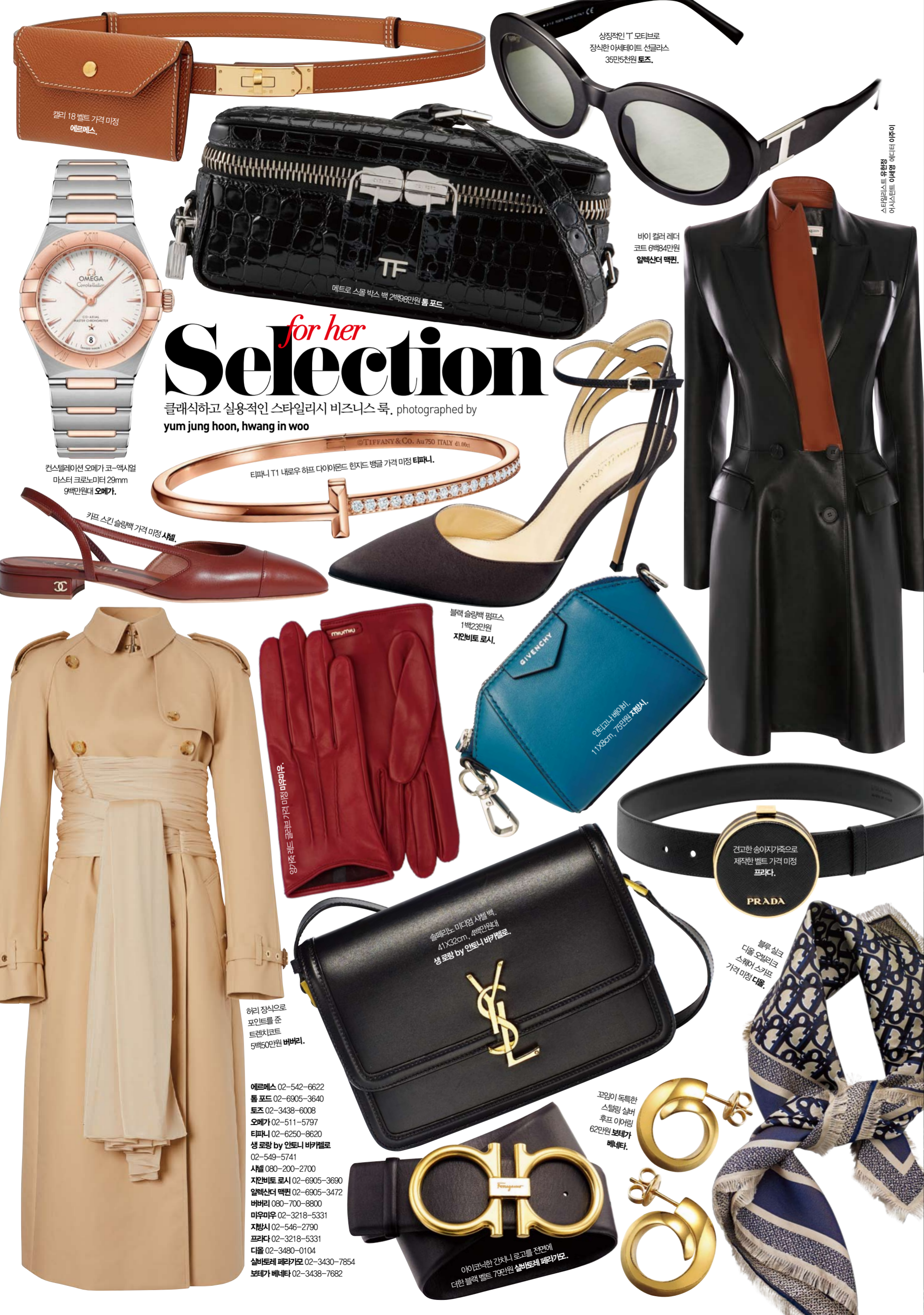
상징적인 T 모티프로 장식한 아사테이트 선글라스 35만5천원 토즈.