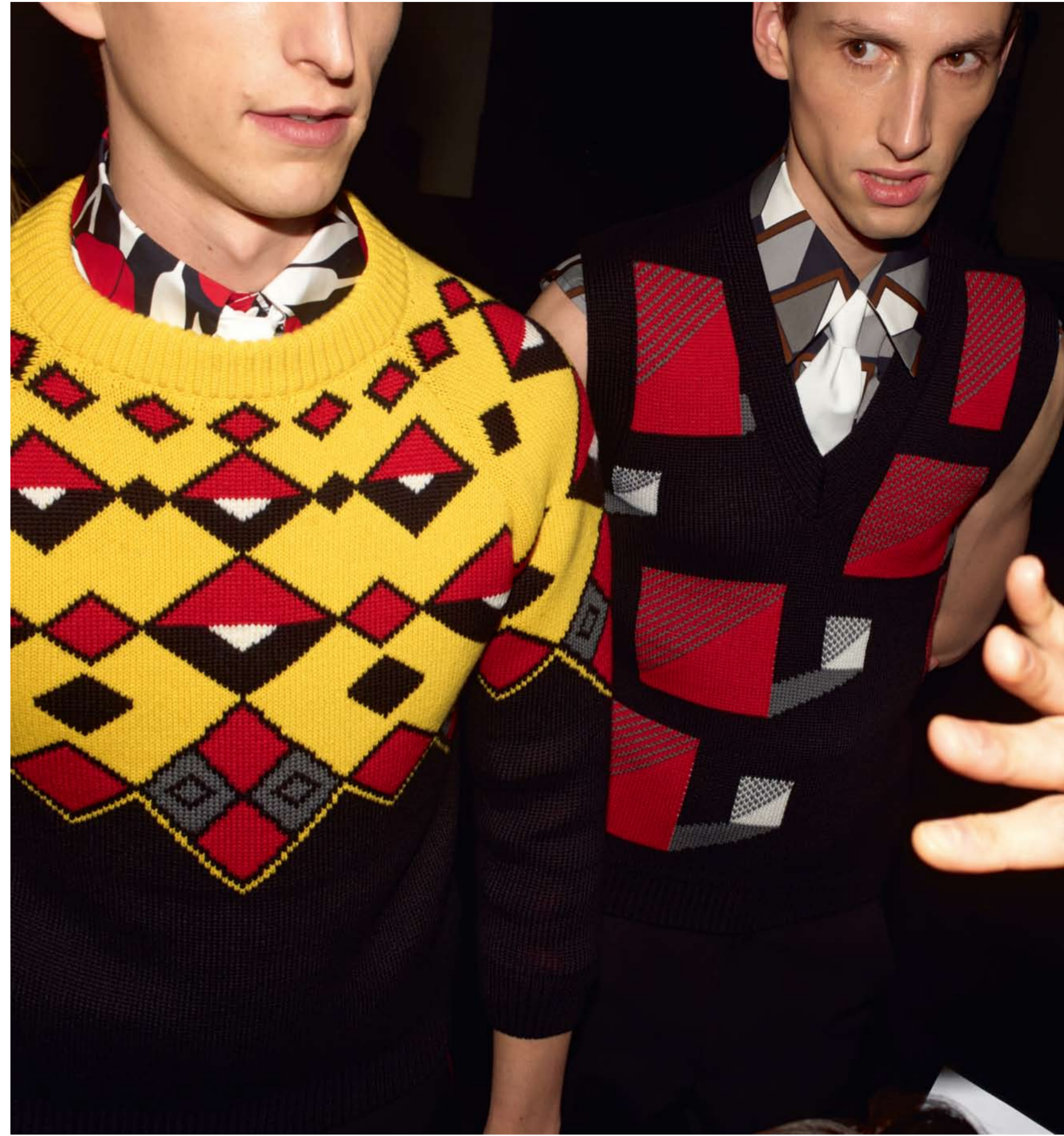
ITEM FEATURED IN AUCTION: GEOMETRIC PRINT, ARGYLE WOOL SWEATER, POPLIN SHIRT, TIE WORN BY MAX TOWNSEND GEOMETRIC PRINT, STRETCH WOOL VEST, POPLIN SHIRT, TIE WORN BY MAXIMILIAN BUNGARTEN AUTHOR: MIUCCIA PRADA