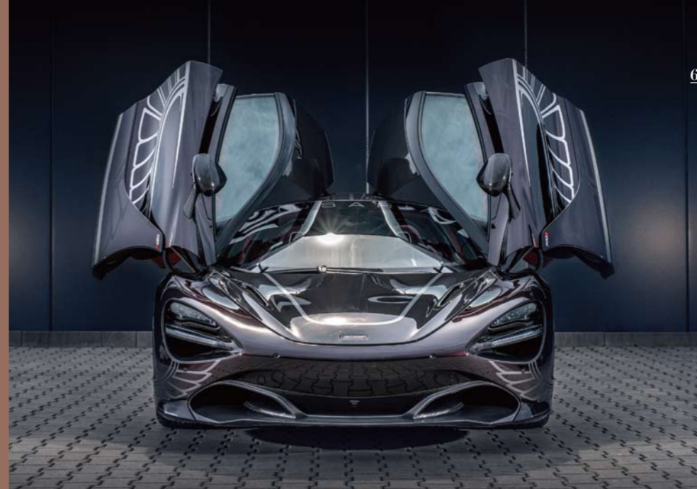
010121 럭셔리 브랜드별

동 면에서 편리한 중형 SUV나 콤팩트 SUV도 여전히 실속 있는 선택일 수 있다. 이 수요를 겨냥해 제네시스도 GV80보다 한 계급 작은 SUV GV70을 연내에 선보일 예정이다. 연내 발표될 브랜드 최초의 양산형 SUV 전기차인 '아우디 e-트론도' 기대감을 불러일으킨다. 특히 캠핑이 확대되고 진화하면서 야외에서 필요한 럭셔리 캠핑용품이 인기를 끄는 것처럼 각종 사양부터 마케팅에 이르기까지 SUV를 둘러싼 럭셔리 미학도 갈수록 일취월장하는 모양새다. 포드자동차의 럭셔리 브랜드 포드는 항공기 1등석이 부럽지 않은 '고요한 비행'을 표방하는 콤팩트 SUV '링컨 코세아'를 올해 출시했는데, MZ세대를 겨냥해 미술관 도슨트 투어까지 할 수 있는 2박 3일의 독특한 캠페인을 연말까지 진행한다. 시승을 경험하는 것은 물론 '잡을 콘셉트로 한 미술관인 양평의 구하우스에서 미술, 영화, 독서, 플라워 등 다양한 주제의 소규모 강의를 듣고 미식도 즐길 수 있는 프로그램이다'(https://www.