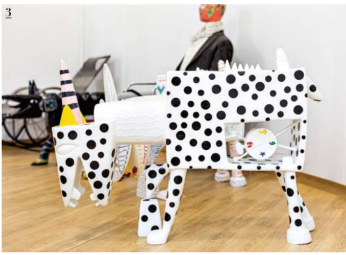
1 뉴욕을 주 무대로 활동하고 있는 최을가. 현재 한국에 머물고 있는 그는 최초로 자신의 국내 작업실을 개방해 미술 애호가들을 맞이한다. '이트조션 아틀리에 프로젝트' 1탄인 이번 전시는 9월 8일부터 19일까지 열린다. 2 파주 헤이리마을에 자리한 최을가 작가의 작업실 모습. 지난해부터 에너지를 쏟고 있는 레드 시리즈가 곳곳에서 눈에 띈다. 3 White(K- Unicorn-004, 2019, 106X78X27cm, Oil and Mixed Media on FRP) 4 Black Series(A Conversation in the Dark, 2018, 121.9X152.4cm, Oil on Canvas) 5 White Series(Brooklyn-014, 2019, 121.9X152.4cm, Oil on Canvas) 1, 2, 3

제각이죠. 빨강은 색의 정정이에요. 수많은 색깔 중에서도 가장 높은 꼭대기에서 있는 능률한 대장 같다고나 할까요. 짧은 시간에도 많은 생각을 하게끔 만들고 감명을 주는 색이니까요." 다른 색을 혼합해 만들 수 없는 일차색인 빨강은 가장 원초적인 색으로 꼽힐 만하다. 사람이 이를 불인 최초의 색이자 구석구석 대 동굴벽화에도 자취가 남아 있는, 세계에서 가장 오래된 색이기도 하지 않은가. 무수한 점으로 바탕을 붉게 물들인 최신작 '레드 시리즈'와 대표 연작인 '블랙 & 화이트 시리즈'를 비롯해 처음 시도한 세라믹 오브제도 선보이는 최을가의 개인전 <인더 비기닝(In the Beginning)>은 9월 8일부터 19일까지 그의 파주 작업실에서 열린다. 오픈 스튜디오형 전시로 기획된 '이트조션 아틀리에 프로젝트' 1탄이다. 최을가의 국내 작업실이 대중에 처음 공개되는 만큼 미술 애호가와 컬렉터에게는 작가와 직접 소통하며 작업 세계를 들여다보는 흔치 않은 기회가 될 것이다. "뉴욕 도시에 있는 아틀리에와는 달리 파주에서는 매일 푸른 자연을 보며 작업할 수 있었어요. 코로나가 준, 생각지 못한 긍정적 경험이었죠. 이런 작업실이 뉴욕에 있다면 천천히 풀려났을 텐데요. 하하." 문의 02-724-7832 글 윤다람/이트조션 기자 에디터 고성연