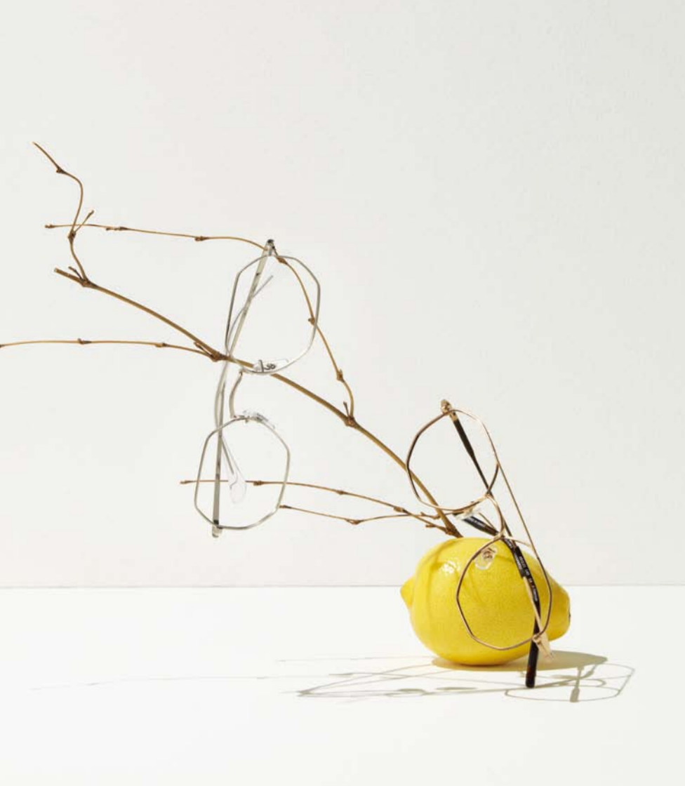
(왼쪽부터) 다각형 메탈 안경테 40만7천원 빅터 앤 폴프 by 시몬 아이베어 , 문의 02-565-6940 골드 컬러 다각형 메탈 안경테 20만원대 레이벤 by 루스티카 , 문의 02-501-4436