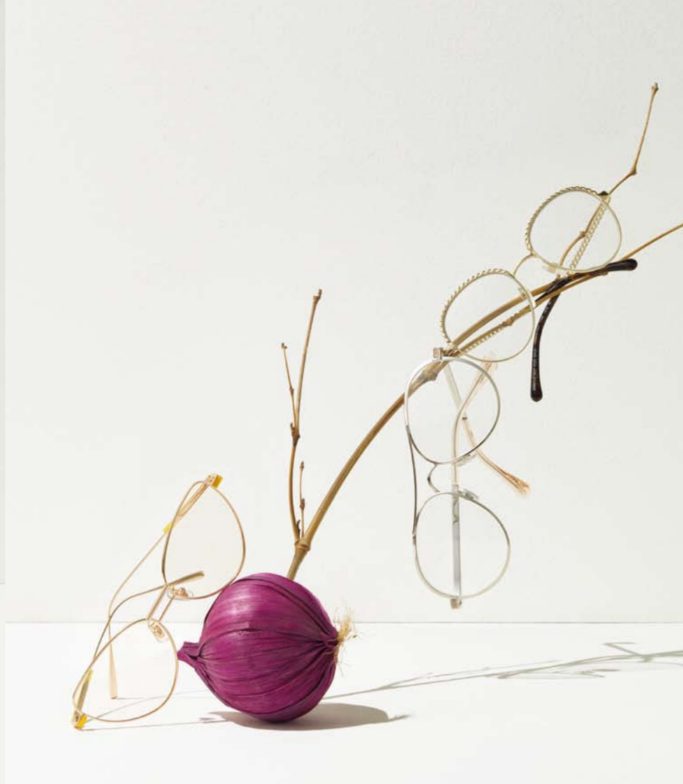
(왼쪽부터) 캣아이 형태의 메탈 안경테 32만원 젠틀몬스터 , 문의 1600-2126 오버사이즈 메탈 안경테 46만원 자미주 by 사필로 , 문의 02-563-8268 표인과 체인 장식으로 포인트를 준 안경테 99만8천원 샤넬 , 문의 080-200-2700, chanel.com