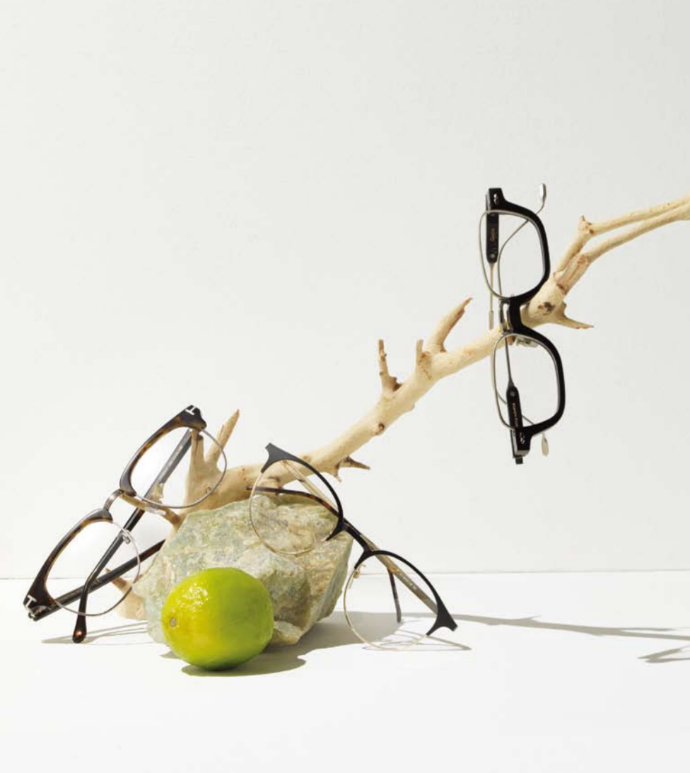
(왼쪽부터) 메탈 프레임에 이색테이스트 소재를 매치한 안경테 56만원 틀 포드 by 브라이언 앤 데이비드 , 문의 02-3446-8552 메탈 소재의 얇고 가벼운 안경테 22만5천원 타이힐피커 by 사필로 , 문의 02-563-8268 직사각 형태의 티타늄 소재와 이색테이스트 프레임을 매치한 안경테 37만5천원 젠틀몬스터 , 문의 1600-2126